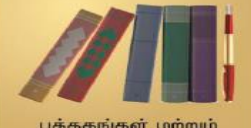
புத்தகங்கள் மற்றும் ஆசிரியர்கள்