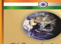
இந்தியா மற்றும் உலகம்