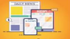
மாதத்தின் முக்கிய செய்திகள்