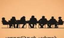
மாநாடுகள் மற்றும் உச்சி மாநாடுகள்