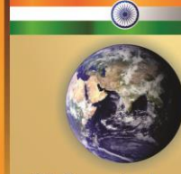
இந்தியா மற்றும் உலகம்