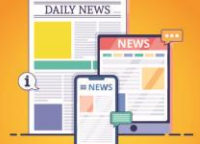
மாதத்தின் முக்கிய செய்திகள்