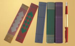
புத்தகங்கள் மற்றும் ஆசிரியர்கள்