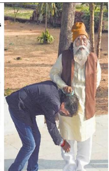
Generation change: Jharkhand Mukti Morcha working president Hemant Soren seeking the blessings of his father and party chief Shibu Soren after the party's success in the Assembly elections, in Ranchi on Monday.

The JMM, Congress and Rashtriya Janata Dal crossed the halfway mark in the 81-seat Assembly by a comfortable margin. The JMM and Congress party also emerged victorious in 47 seats – their highest ever tally of seats won individually since the formation of Jharkhand in 2000.